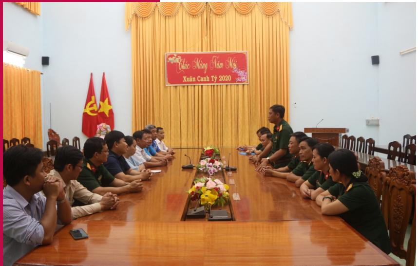
Chúc Tết tại Sư đoàn 330.

Lãnh đạo các đơn vị bộ đội cũng đã thân tình chia sẻ khái quát về tình hình thực hiện nhiệm vụ công tác của đơn vị, luôn giữ vững tinh thần sẵn sàng chiến đấu, quyết tâm bảo vệ vững chắc biên cương, góp phần giữ vững an ninh, độc lập của Tổ quốc. Trong chuyến giao lưu, Công đoàn và Đoàn Thanh niên trường đã gửi tặng quà cho Đồn Biên phòng Vĩnh Gia và Đoàn Thanh niên Sư đoàn 330 để hỗ trợ thực hiện công trình thanh niên tại đơn vị.