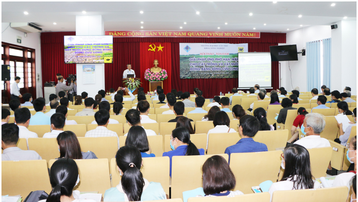
Toàn cảnh Hội thảo tại Hội trường 4, Nhà Điều hành, Trường ĐHCCT.

Ngày 20/02/2020, Trường ĐHCCT tổ chức Hội thảo-Tọa đàm “Giải pháp ứng phó hạn, mặn cho cây trồng và vật nuôi vùng ĐBSCL” với sự tham dự của hơn 300 đại biểu từ các viện, trường, sở, chi cục, trung tâm khuyến nông các tỉnh, thành trong vùng.